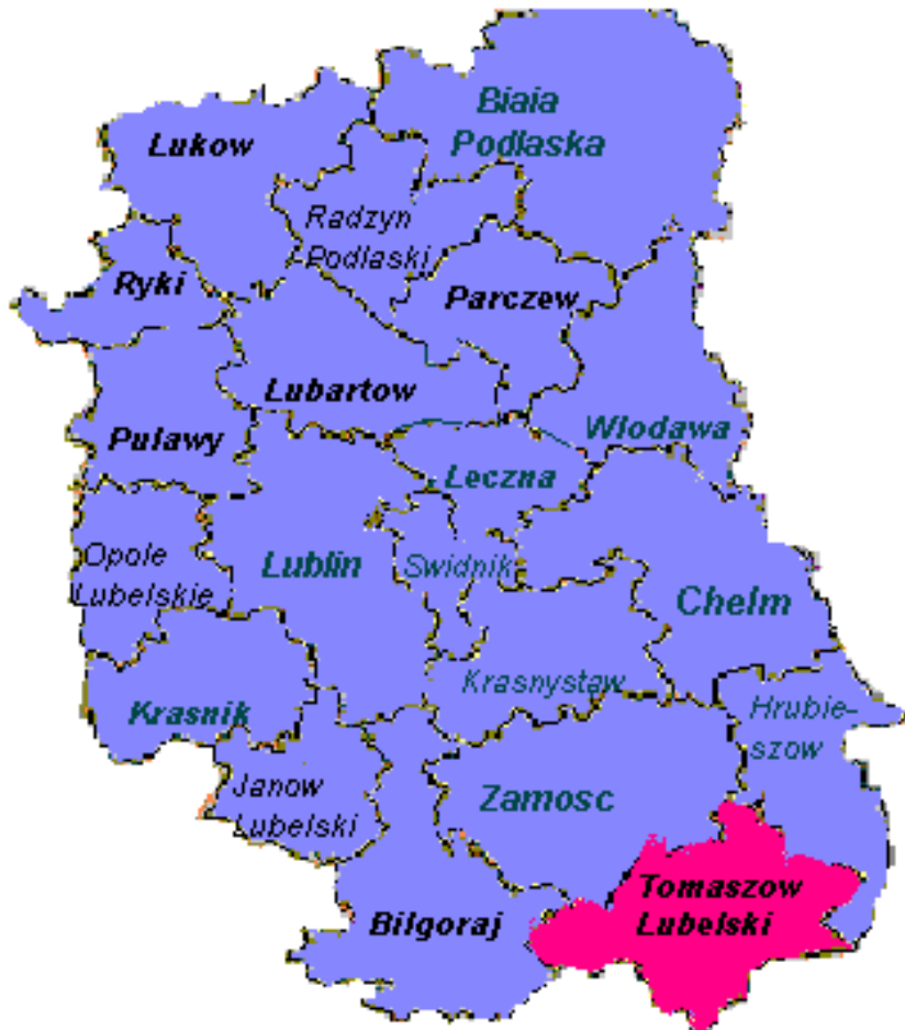
Mapa nr 2

Nieskażone środowisko przyrodnicze regionu tomaszowskiego, oraz malowniczo położone gospodarstwa rolne powinny sprzyjać rozwojowi różnych form wypoczynku, agroturystyki, turystyki zorganizowanej szczególnie na terenach roztoczańskich.