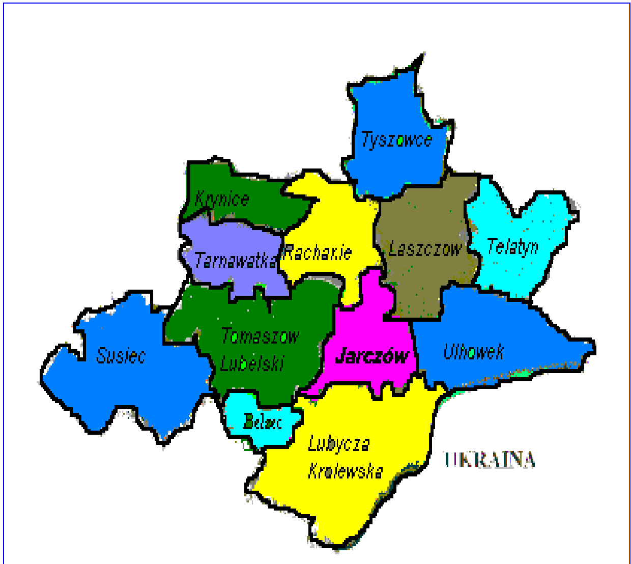
Gminy powiatu tomaszowskiego