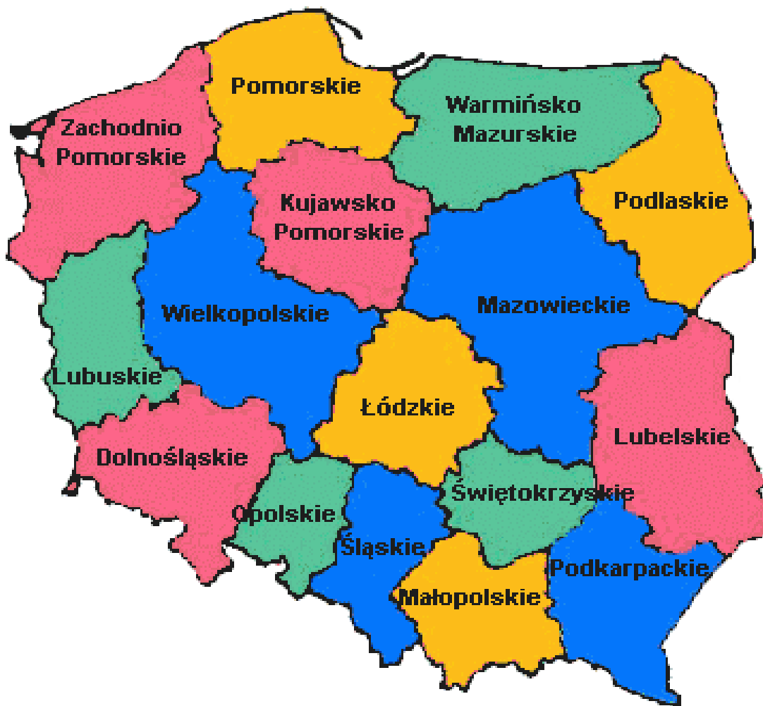
Mapa Polski w układzie województw.